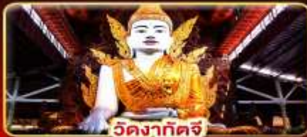
วัดงาทัดจี

สักการะ 3 มหาบูชาสถาน พักบนอินทร์แวน 1 คืน