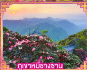
ภูเขาหมีช้างซาน