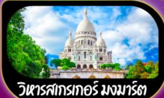
วิหารสกรเทอร์ มงมาร์ต