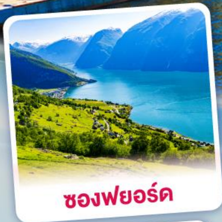
ช่องฟยอร์ด