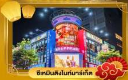
ช้อปปิ้งในทงมาร์เก็ต