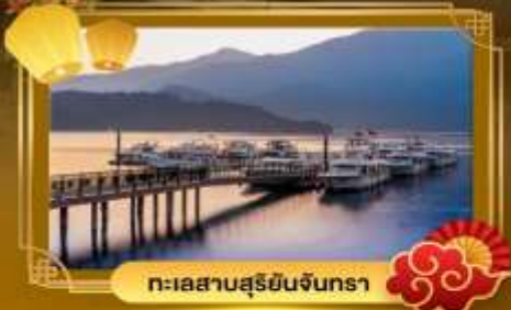
ทะเลสาบสุริยจันทร์