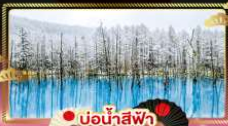
● บ่อน้ำสีฟ้า

สัมผัส ซากุระแรกฤดู และหิมะท้ายฤดูแห่งปี สีสันแห่งชีวิตชีวา