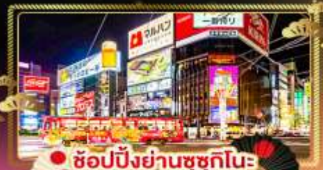
● ช้อปปิ้งย่านชุกุชิโนะ