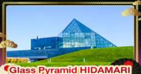
● Glass Pyramid HIDAMARI