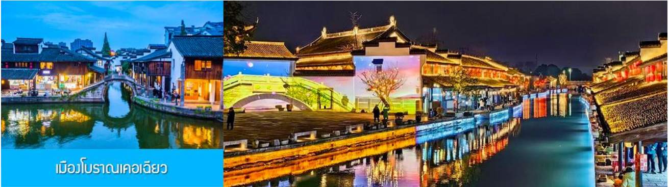
เมืองโบราณเคอเจียว