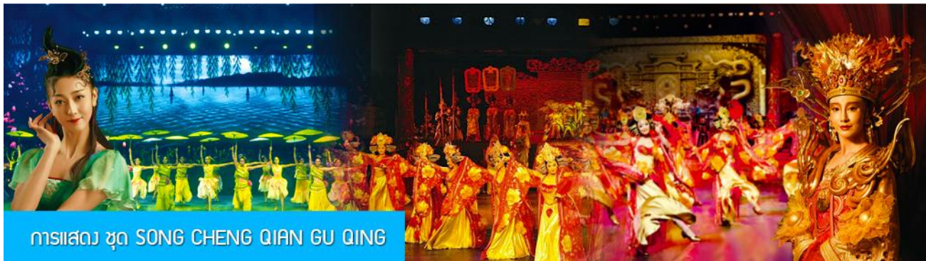
การแสดง ชุด SONG CHENG QIAN GU QING