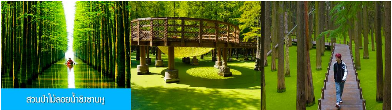
สวนป่าไผ่ลอยน้ำชิงชานหู