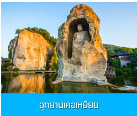
อุทยานเคอเหยียน

พักที่ โรงแรม KAIYUAN MINGTING HOTEL 4* หรือเทียบเท่าในเมืองเส้าชิง