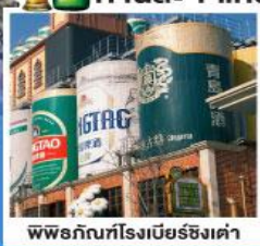
พิพิธภัณฑ์เบียร์ชิงเต่า