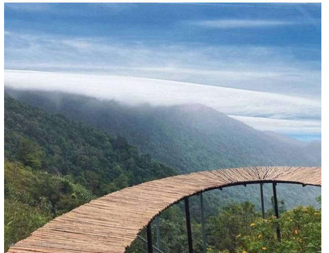
นำท่านเดินทางสู่ สะพานเมฆ (Cau May) เป็นอีกหนึ่งจุดเช็คอินยอดนิยม สถานที่แห่งนี้มีสะพานไม้หลายแห่งที่รองรับด้วยคานเหล็กทอดยาวไปบนไหล่เขาให้ท่านได้ชมทิวทัศน์ภูเขาที่โอบล้อมและ เหมือนได้เดินอยู่เหนือเมฆ ตั้งบนสวรรค์