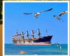
เรือสินค้าเทียบตึ้นบลูอิส