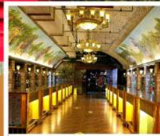
พิพิธภัณฑ์ไวน์ชิงเต่า