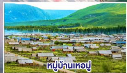
หมู่บ้านหอยมู่