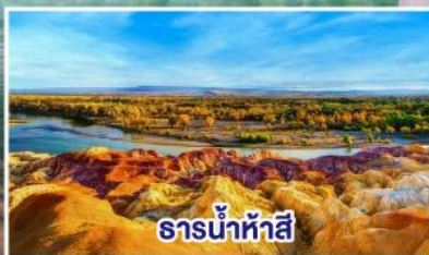
ธารน้ำห้าสี