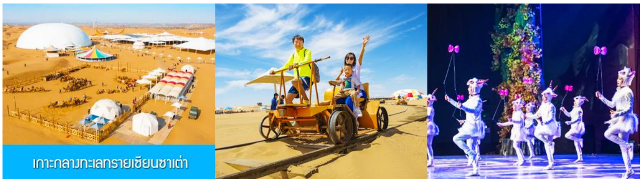
เกาะกลางทะเลทรายเขียนซาเต๋า