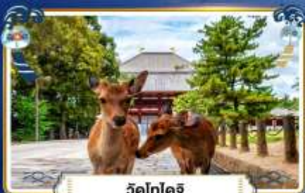
วัดโทไดจิ