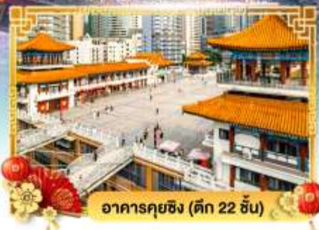
อาคารกุยชิง (ตึก 22 ชั้น)