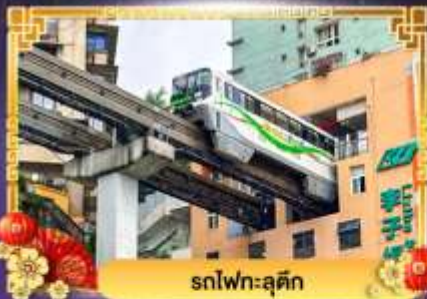
รถไฟฟ้าชุงชิ่ง