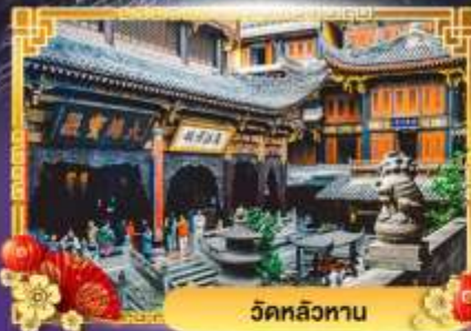
วัดหลิวทาน