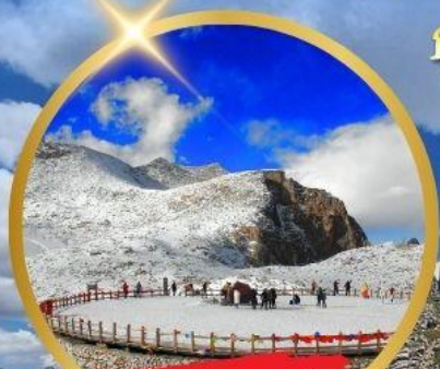
OPTIONAL TOUR ธารน้ำแข็งต่ากู่ปิงชวน