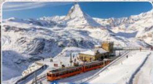
นั่งรถไฟสู่ยอดเขา กรอนเนอ์เกรต