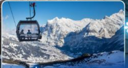
นั่งกระเช้าและรถไฟสู่ ยอดเขาจุงเฟรา