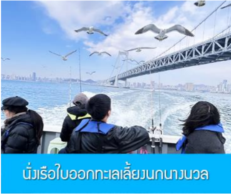
นั่งเรือใบออกทะเลลิ้นงนางนวล

ต่อด้วยนำท่านเที่ยวชมถนนรัสเซีย 俄罗斯风情街 ในอดีตที่นี่เป็นศูนย์ที่ตั้งของที่ทำการเมืองต้าเหลียน ภายหลังได้กลายเป็นชุมชนของพ่อค้าและวิศวกรทางรถไฟชาวรัสเซีย บริเวณนี้จึงเต็มไปด้วยอาคารบ้านเรือนแบบตะวันตก(รัสเซีย) มากมาย นอกจากนี้ได้เก็บภาพที่มีพื้นหลังเป็นอาคารสถาปัตยกรรมตะวันตก ที่นี้ยังมีร้านค้าที่จำหน่ายสินค้าและของที่ระลึกที่นำเข้ามาจากรัสเซีย อาทิ ช็อกโกแลต เหล้าวอดก้า ตุ๊กตารัสเซีย ฯลฯ