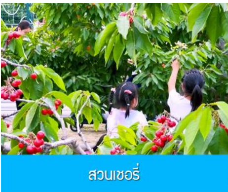
สวนชอร์รี่

หลังอาหารเช้า โดยรถบัสสู่ เมืองตันตง 丹东 (ระยะทาง 300 กม. ใช้เวลาเดินทางโดยรถบัส ประมาณ 3 ชั่วโมงครึ่ง)