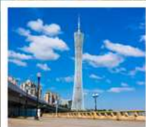
จุดริสฮิวเอ็ง