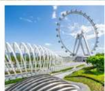
สวนสาธารณะ: OH BAY