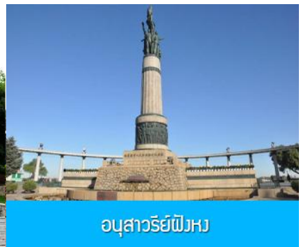
อนุสาวรีย์พิงหว