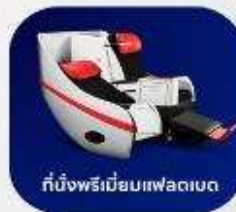
ที่นั่งพรีเมียมแพลนเน็ต