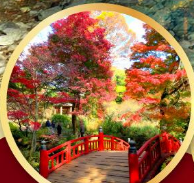
สวนดอกบ๊วยอาคาบิ