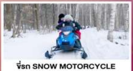
ขี่รถ SNOW MOTORCYCLE