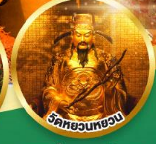
วัดหยวนหยวน

ขอพรเรื่องสุขภาพ, โชคลาภ ความเจริญก้าวหน้า